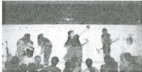
ホクト文化ホールロビーコンサート出演。