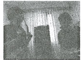
デイサービスにて出張演奏。